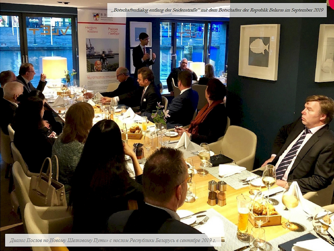
Диалог Послов по Новому Шелковому Пути с послом Республики Беларусь в сентябре 2019 г.

„Botschafterdialog entlang der Seidenstraße“ mit dem Botschafter der Republik Belarus im September 2019