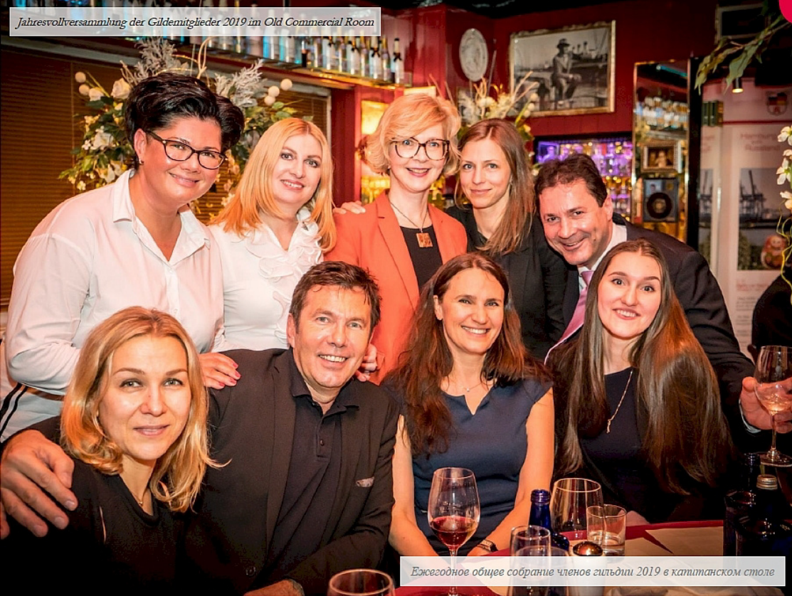
Ежегодное общее собрание членов гильдии 2019 в катинском столе