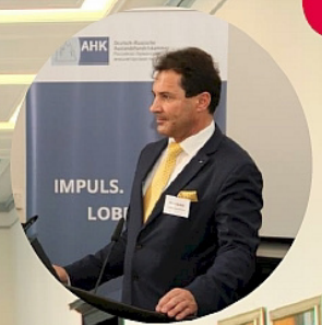
Германо-российский логистический форум с Восточным комитетом – Восточноевропейская ассоциация немецкого бизнеса и немецко-российский АХК в Гамбургской торговой палате в сентябре 2019 г.