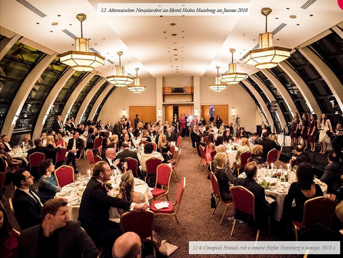
12-й Старый Новый год в отеле Hafen Hamburg в январе 2018 г.