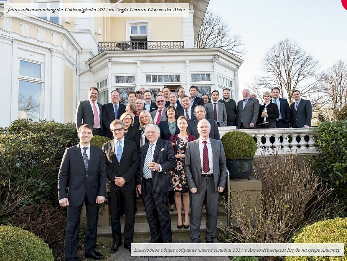
Ежегодное общее собрание членов гильдии 2017 в Англо-Немецком Клубе на озере Альстер